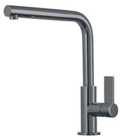
Monomando Omega Gun Metal