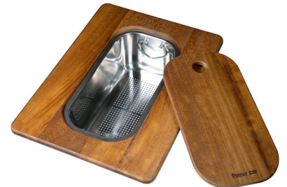
Tabla de corte Twin de madera Iroko con escurrir pasta en acero inoxidable

* sólo en combinación con el accesorio 8644 101