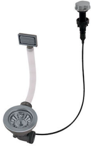
Desagüe automático Gun metal - PG 8407 110