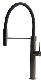
Monomando Skin Gun Metal